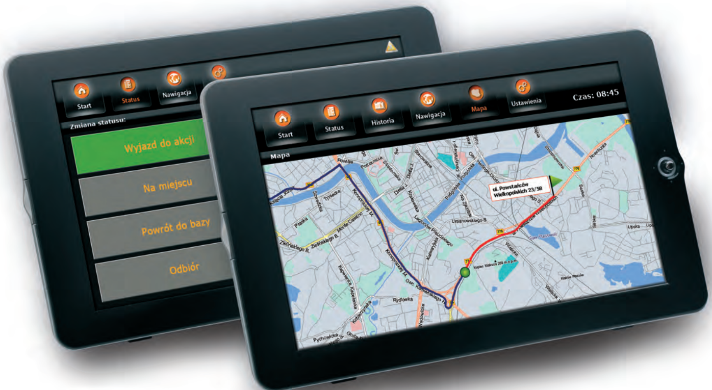
Terminal Statusów z wyświetlaczem graficznym i ekranem dotykowym.